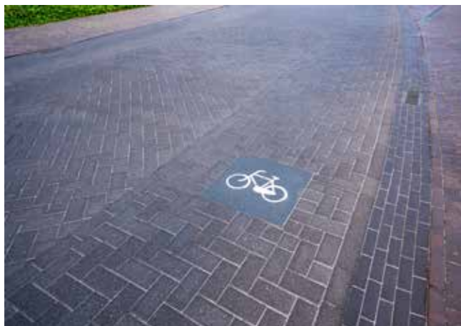
Voor de benodigde betonbanden en tegels kon aannemer Dura Vermeer ook bij Morssinkhof Infra terecht. Daarmee had de gemeente één leverancier voor de gebakken en de betonnen materialen.