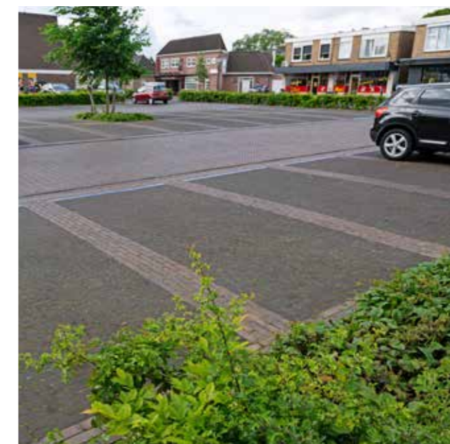
Voor de parkeerplaatsen en goten viel de keuze op een antraciet straatbaksteen in dikformaat, onbezand voor de parkeervakken en goten in het centrum.

Voor de verharding van het centrumgebied was de gemeente op zoek naar een nostalgische steen, die warmte en gezelligheid uitstraalt en die past bij de bestaande gebouwen. Gebakken bestrating wel te verstaan, omdat de lange levensduur van dit product aansluit bij de gedachte om het centrum duurzaam in te richten. Brinkman baksteencentrum, onafhankelijke baksteenhandelaar en zusterbedrijf van Morssinkhof Infra, schreef in op de Europese aanbesteding. Zij koos uit de stenen van al haar leveranciers voor een onbezande bruine straatbaksteen in dikformaat. Juist de specifieke kleur van die steen onderscheidde de inschrijving van de andere. Het bleek een perfecte match met de bestaande gebouwen in Losser en de wensen van de gemeente.