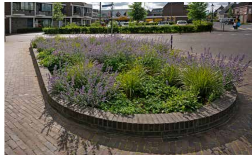
De bloembakken leveren met de grote variatie aan bloemen en planten een bijdrage aan de biodiversiteit. Brinkman baksteencentrum leverde de gebakken gevelstenen voor de bakken zelf.

Morssinkhof Groep ziet het als een uitdaging om de potentiële creativiteit van bijvoorbeeld de landschapsarchitect of stedenbouwkundige samen te brengen met de expertise en het inspirerend vermogen van de designmanager. Niet voor het eerst zijn daardoor betonnen bestratingsproducten specifiek voor een project ontwikkeld en dus uniek toegepast.