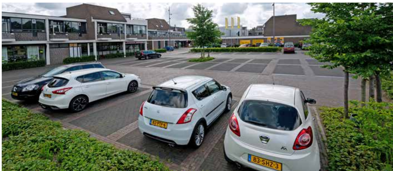
Geglazuurde, blauwe straatbakstenen markeren de parkeervakken. Onder de grote parkeerplaats bij de supermarkt ligt een waterinfiltratiesysteem met kunststof kratten. Deze vangen regenwater op, op de plek waar het valt, zodat het rioelstelsel wordt ontzien. Het opgevangen water dient als watervoorziening voor omliggende bomen.

Met een planning die begon in 2015 en die afgerond werd in 2021 mag de herinrichting van het centrum van Losser met recht een groot project genoemd worden. Een groot project dat dankzij de bijzondere samenwerking tussen alle partijen ook een groots resultaat heeft opgeleverd. Het centrum van Losser heeft een complete metamorfose ondergaan. Maar liefst 18.000 m 2 gebakken straatbakstenen dikformaat bruin gereduceerd gestookt zijn hier toegepast. En uit enquêtes onder ondernemers en inwoners van het dorp blijkt dat niet alleen de gemeente dik tevreden is!